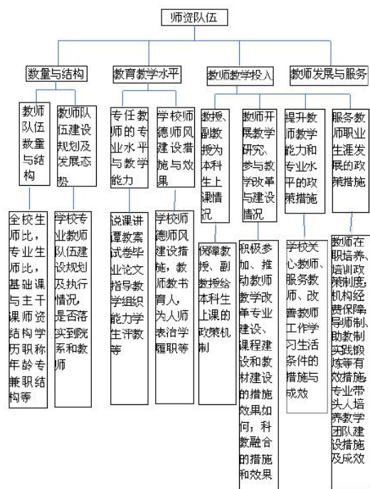
图3 “师资队伍”项目、要素、要点、支撑材料关系